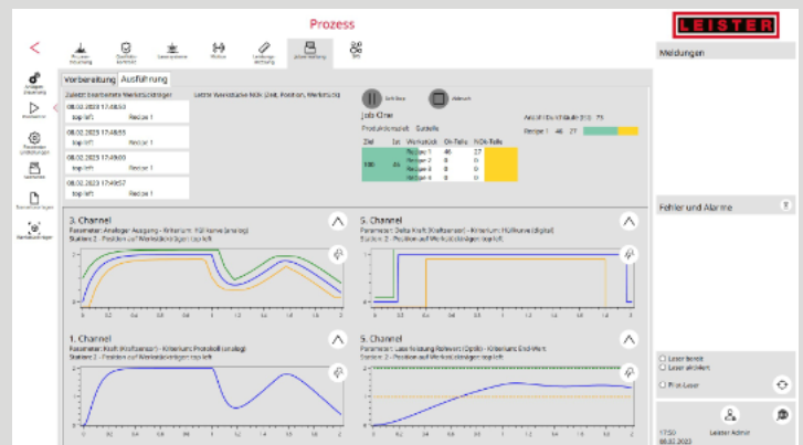
Abb. 2: HMI-Oberfläche

Mit dem Know-how der beiden Technologieführer Leister und AUNOVIS konnte die Entwicklung des geplanten HMI schnell mit hoher Qualität auf den Weg gebracht werden.